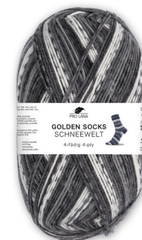
Farbe Nr. 512.08