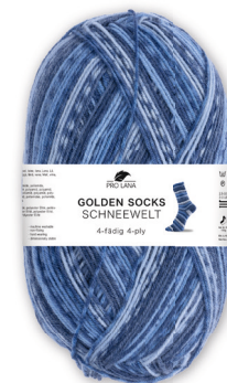
Farbe Nr. 379.04