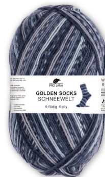
Farbe Nr. 512.09