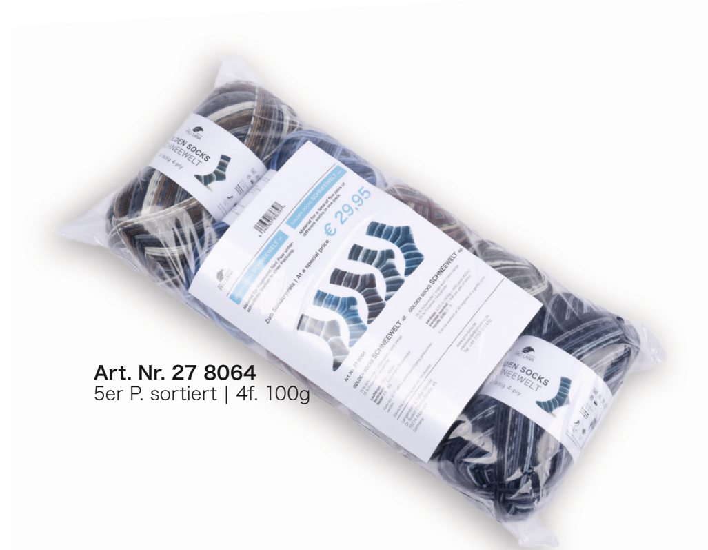
Art. Nr. 27 8064 5er P. sortiert | 4f. 100g