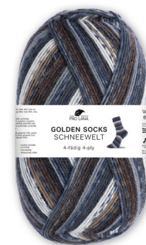
Farbe Nr. 379.B