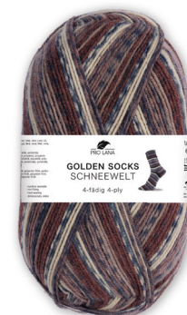
Farbe Nr. 512.07