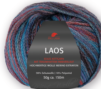
Farbe Nr. 85 meer