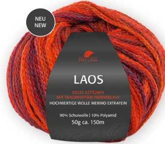
Farbe Nr. 90 glut