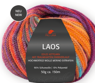
Farbe Nr. 91 rainbow