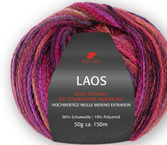
Farbe Nr. 82 beere