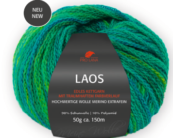
Farbe Nr. 88 frühling