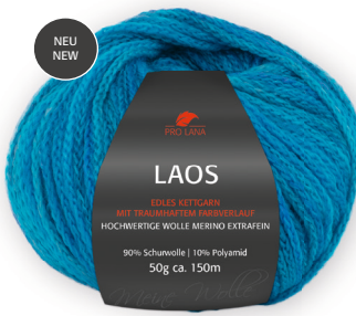
Farbe Nr. 89 ozean