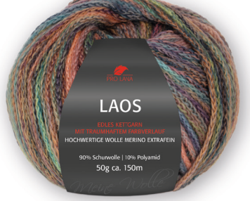
Farbe Nr. 84 koralle