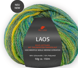
Farbe Nr. 87 wiese