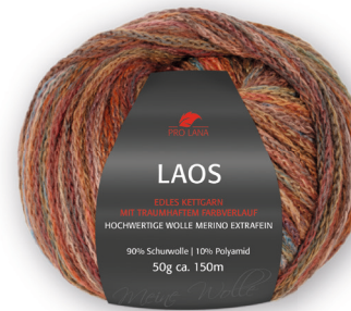
Farbe Nr. 81 herbst