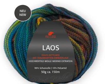
Farbe Nr. 92 winter