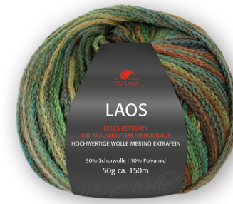
Farbe Nr. 83 jungle