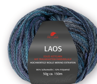
Farbe Nr. 86 nacht