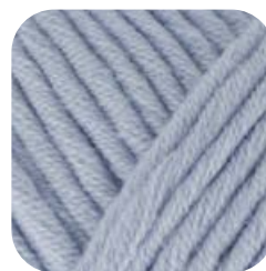
Farbe Nr. 456