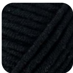
Farbe Nr. 499 *