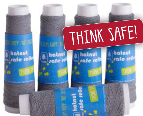
Farbe Nr. 90