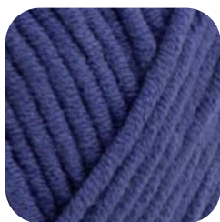
Farbe Nr. 451