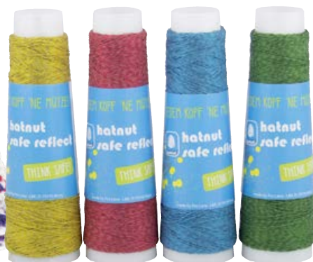
Farbe Nr. 22 Farbe Nr. 30 Farbe Nr. 69 Farbe Nr. 70