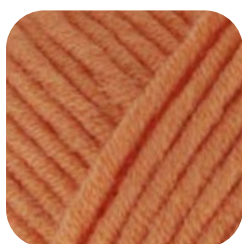
Farbe Nr. 428