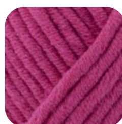
Farbe Nr. 437