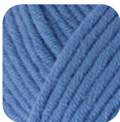
Farbe Nr. 453