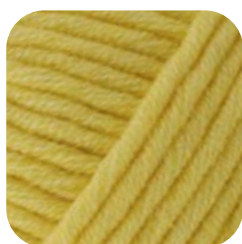
Farbe Nr. 421

50% Baumwolle 50% Polyacryl 50g Knäuel Laufänge 65m/50g Nadelstärke 5,0 – 6,0