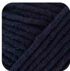
Farbe Nr. 450