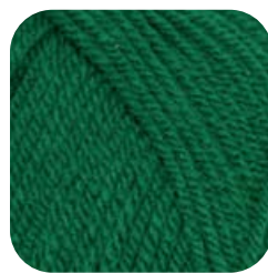
Farbe Nr. 70