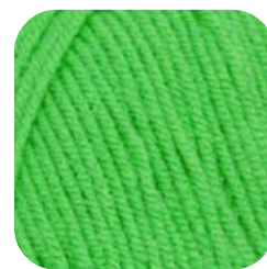
Farbe Nr. 83