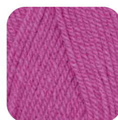
Farbe Nr. 35