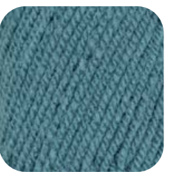
Farbe Nr. 63