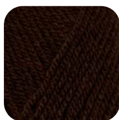
Farbe Nr. 10