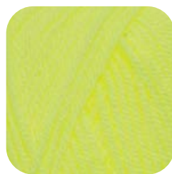
Farbe Nr. 82