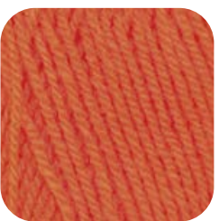
Farbe Nr. 81