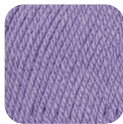
Farbe Nr. 43