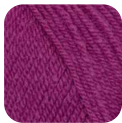
Farbe Nr. 37