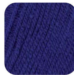
Farbe Nr. 51