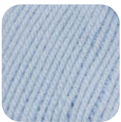
Farbe Nr. 56