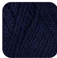
Farbe Nr. 50