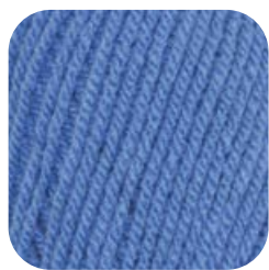
Farbe Nr. 53