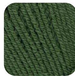
Farbe Nr. 72