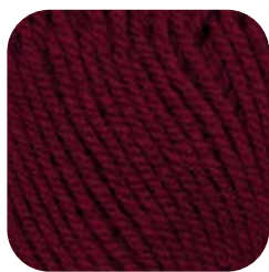
Farbe Nr. 38