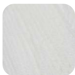
Farbe Nr. 01

50% Schurwolle 50% Polyacryl 50g Knäuel Laufänge 133m/50g Nadelstärke 3,0 – 4,0