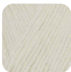
Farbe Nr. 02