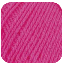
Farbe Nr. 80