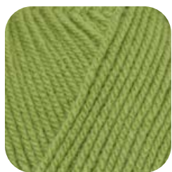
Farbe Nr. 74