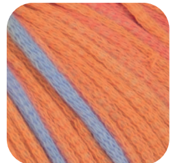
Farbe Nr. 84*