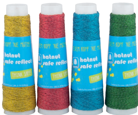
Farbe Nr. 22 Farbe Nr. 30 Farbe Nr. 69 Farbe Nr. 70