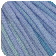
Farbe Nr. 81