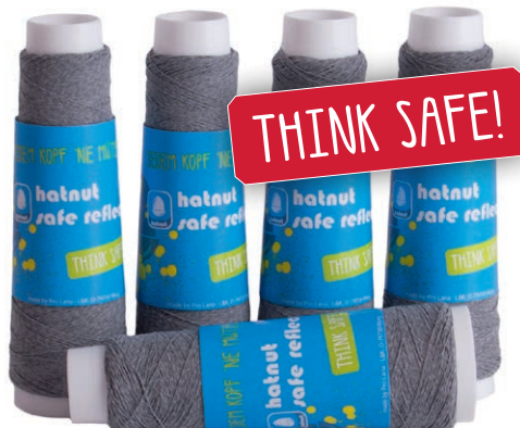
Farbe Nr. 90