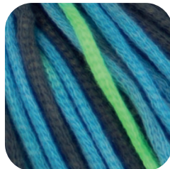
Farbe Nr. 82