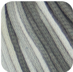
Farbe Nr. 80