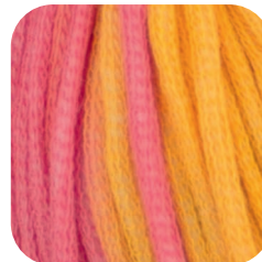
Farbe Nr. 83