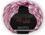
Farbe Nr. 84 rosé