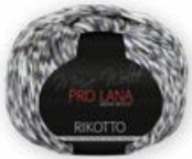
Farbe Nr. 80 hellgrau

100% Baumwolle Lauffänge 180m/50g Nadelstärke 3,0 – 4,0