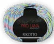
Farbe Nr. 83 türkis