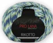
Farbe Nr. 82 petrol