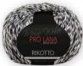
Farbe Nr. 81 dunkelgrau