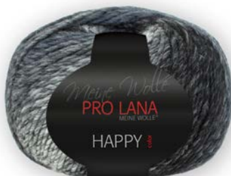
Farbe Nr. 184