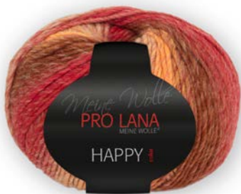
Farbe Nr. 181

70% Polyacryl 30% Schurwolle Lauflänge 300m/150g Nadelstärke 5,0 – 6,0