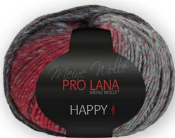
Farbe Nr. 185