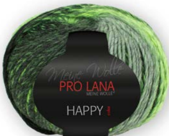
Farbe Nr. 183