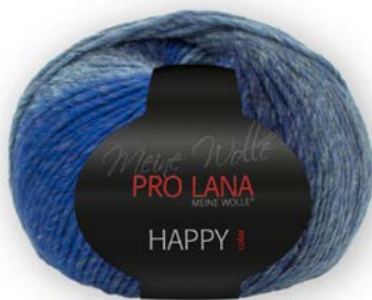
Farbe Nr. 182