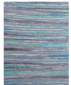
Farbe Nr. 84