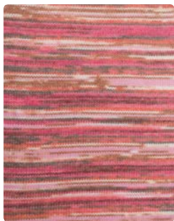
Farbe Nr. 80