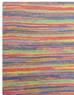
Farbe Nr. 82