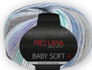
Farbe Nr. 84