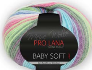
Farbe Nr. 83