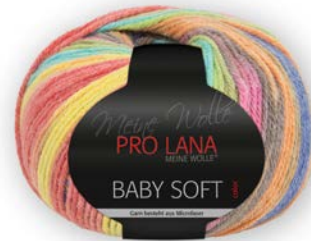
Farbe Nr. 82