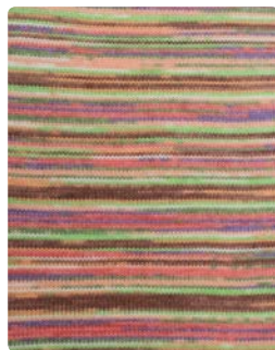
Farbe Nr. 81