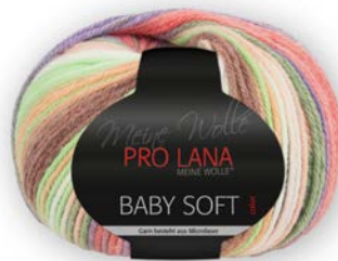
Farbe Nr. 81