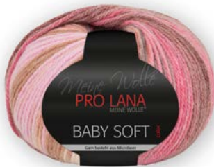
Farbe Nr. 80

50% Polyacryl 50% Polyamid Lauflänge 155m/50g Nadelstärke 3,5 – 4,5