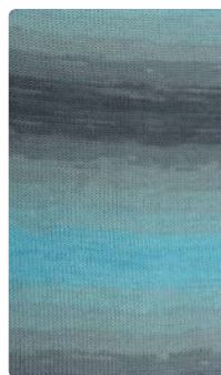
Farbe Nr. 65