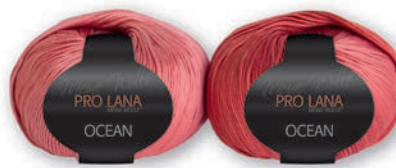
Farbe Nr. 37 altrosé-rosé