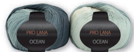
Farbe Nr. 95 weiß-blaugrau NEU