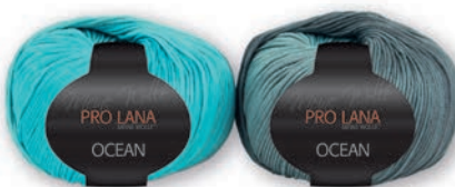
Farbe Nr. 65 türkis-grau NEU