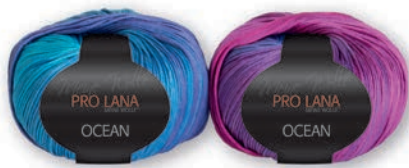
Farbe Nr. 34 pink-blau

100% Baumwolle/Cotton Mercerisiert/gasiert/ Egypt-cotton Lauflänge 110m/50g Nadelstärke 3,5 – 4,5