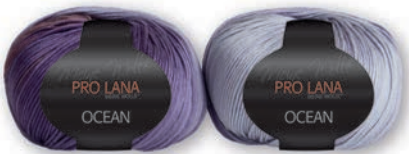
Farbe Nr. 48 lila-flieder