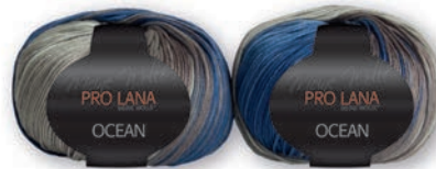
Farbe Nr. 51 blau-silber