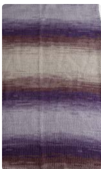
Farbe Nr. 48