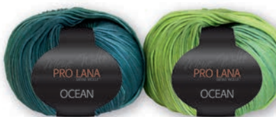
Farbe Nr. 70 grün-petrol