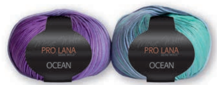
Farbe Nr. 43 violett-türkis