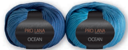
Farbe Nr. 55 blau-türkis