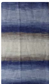
Farbe Nr. 51