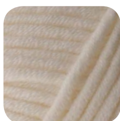
Farbe Nr. 402