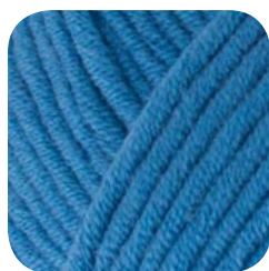
Farbe Nr. 453