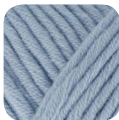
Farbe Nr. 456