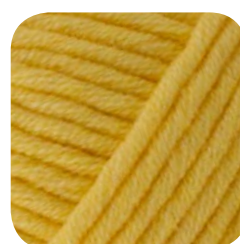
Farbe Nr. 421