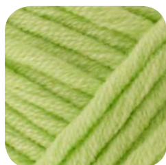
Farbe Nr. 474