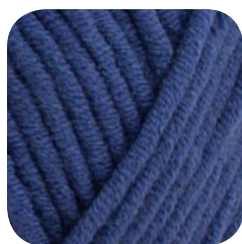
Farbe Nr. 451