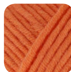
Farbe Nr. 428