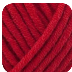
Farbe Nr. 430