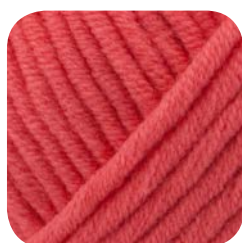
Farbe Nr. 434