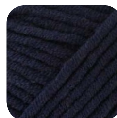
Farbe Nr. 450