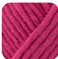
Farbe Nr. 437