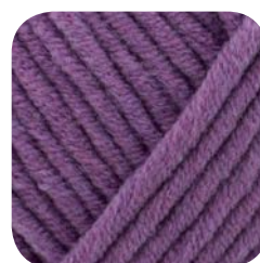
Farbe Nr. 443