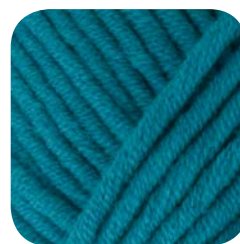
Farbe Nr. 465