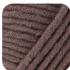
Farbe Nr. 408 (*)