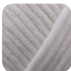
Farbe Nr. 401

50% Baumwolle 50% Polyacryl 50g Knäuel Laufänge 65m/50g Nadelstärke 5,0 – 6,0