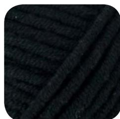
Farbe Nr. 499

FÜR DEN FRÜHLING, SOMMER, HERBST UND WINTER!