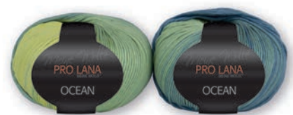
Farbe Nr. 25 hellgrün-blau