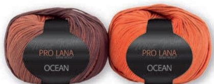
Farbe Nr. 27 orange-braun NEU