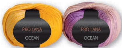
Farbe Nr. 22 gelb-lila