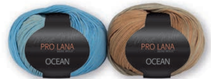
Farbe Nr. 12 blau-hellbraun