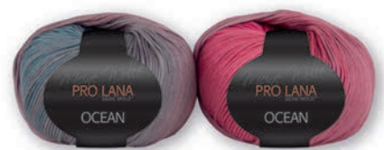
Farbe Nr. 33 beere-altviolett