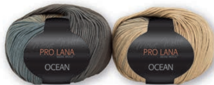
Farbe Nr. 10 beige-grau NEU