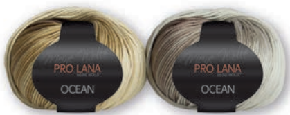
Farbe Nr. 08 oliv-granit

100% Baumwolle/Cotton Mercerisiert/gasiert/ Egypt-cotton Laufänge 110m/50g Nadelstärke 3,5 – 4,5