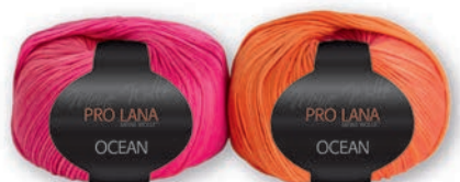
Farbe Nr. 28 orange-pink