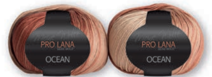
Farbe Nr. 26 rotbraun-koralle